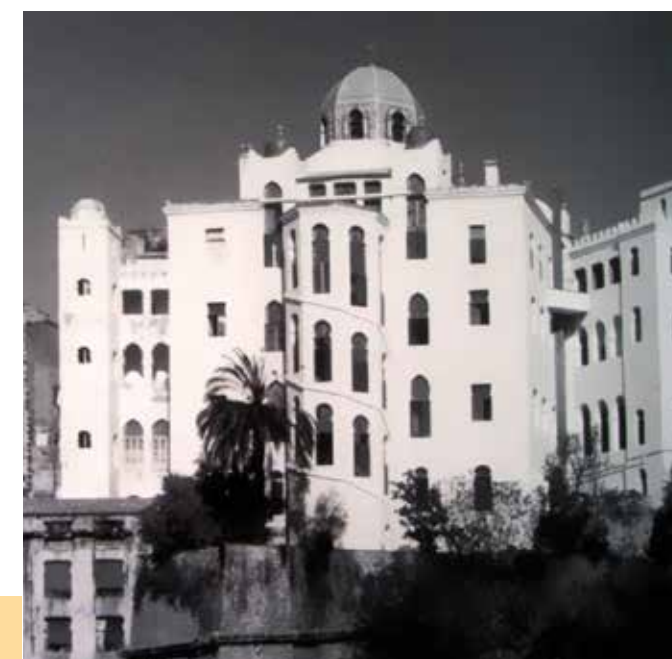
Médersa de Constantine

17h15 discussion 17h45 conclusions 18h00 fin du colloque